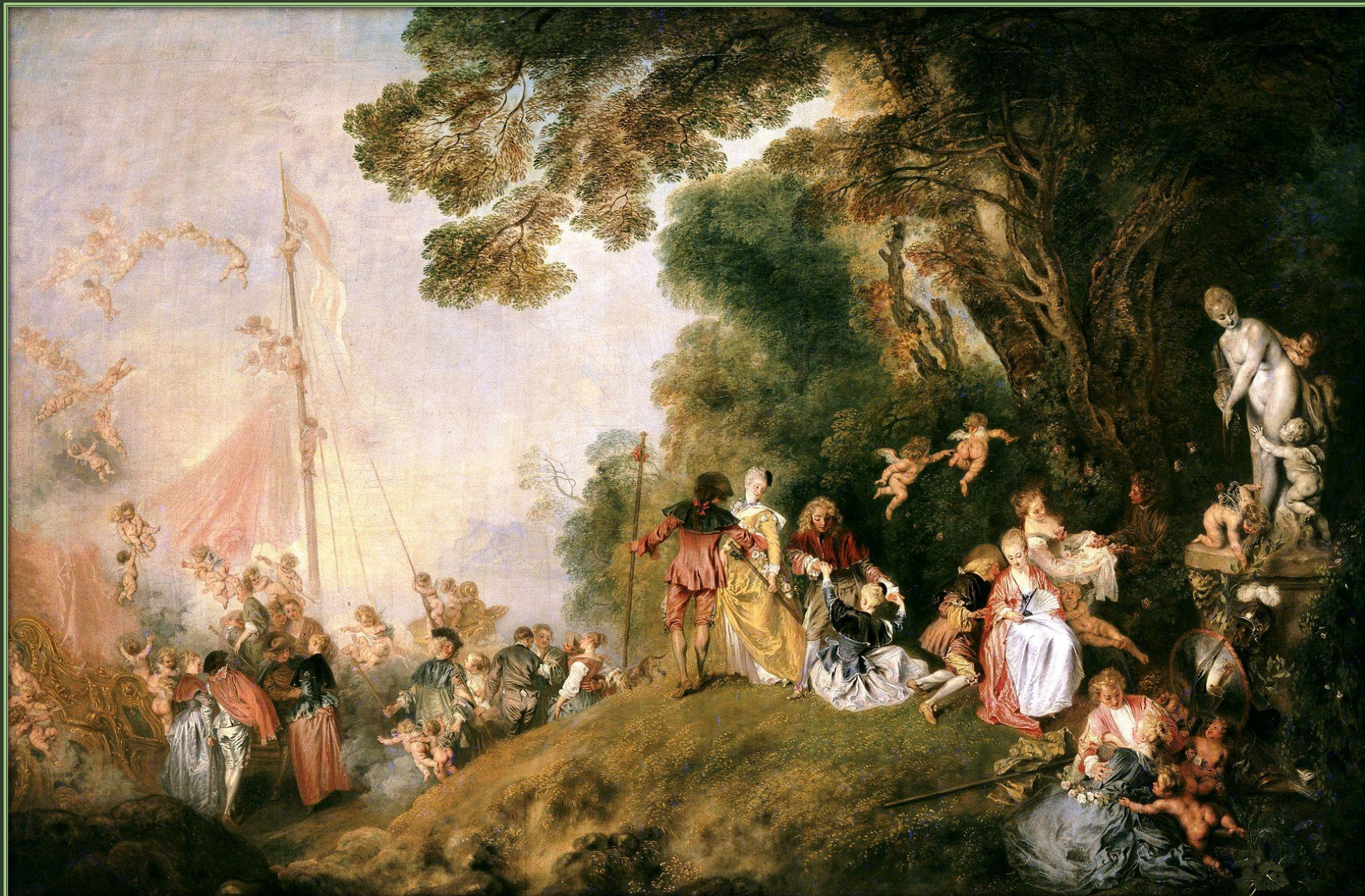
Жан Антуан Ватто. Паломничество на остров Киферу (второй вариант), 1718. Холст, масло. Дворец Шарлоттенбург, Берлин