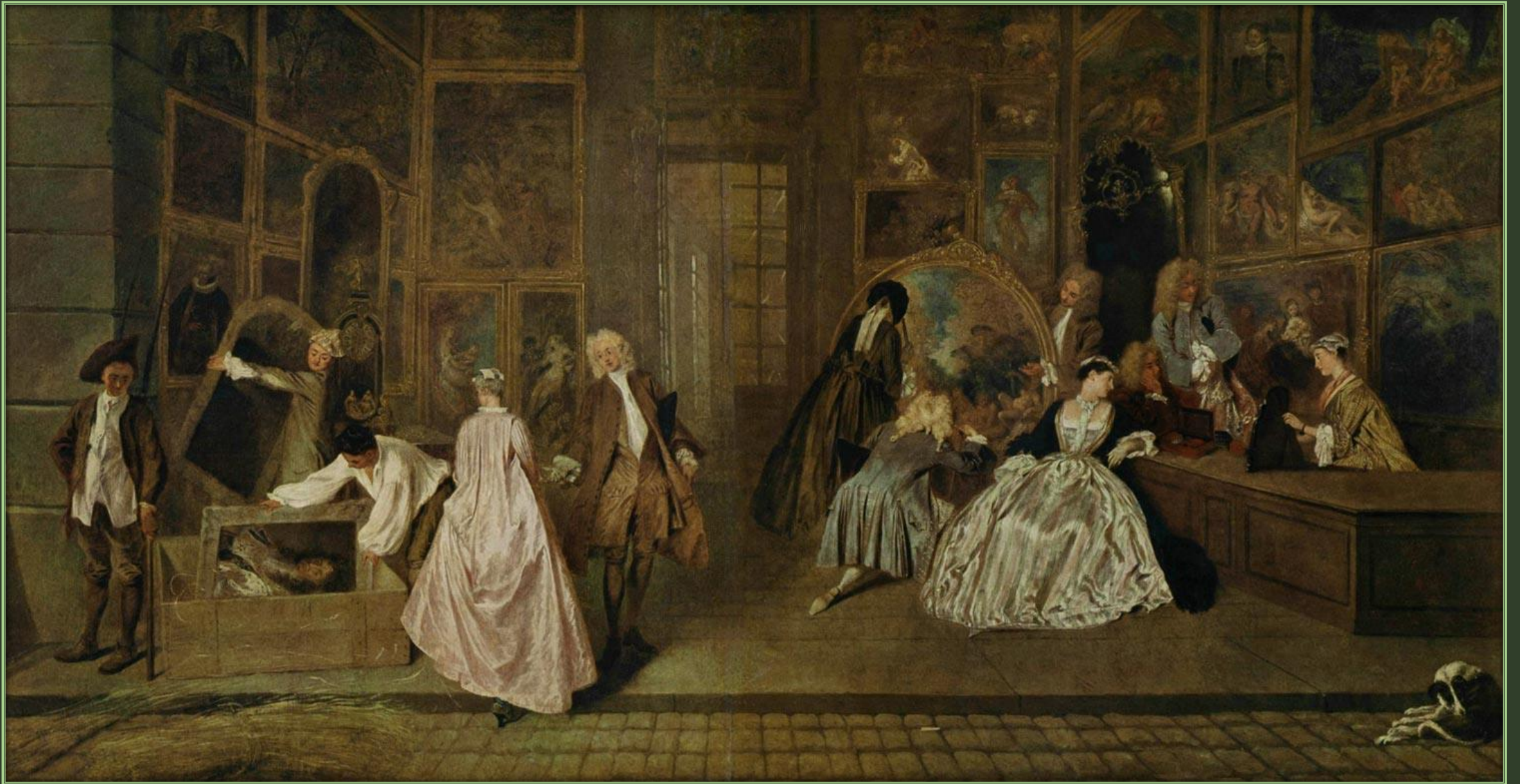
Жан Антуан Ватто. Вывеска лавки Жерсена, 1720 – 1721 Хорлст, масло. Дворец Шарлоттенбург, Берлин