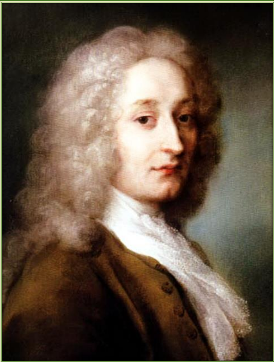
Розальба Каррьера. Портрет Ватто, 1721