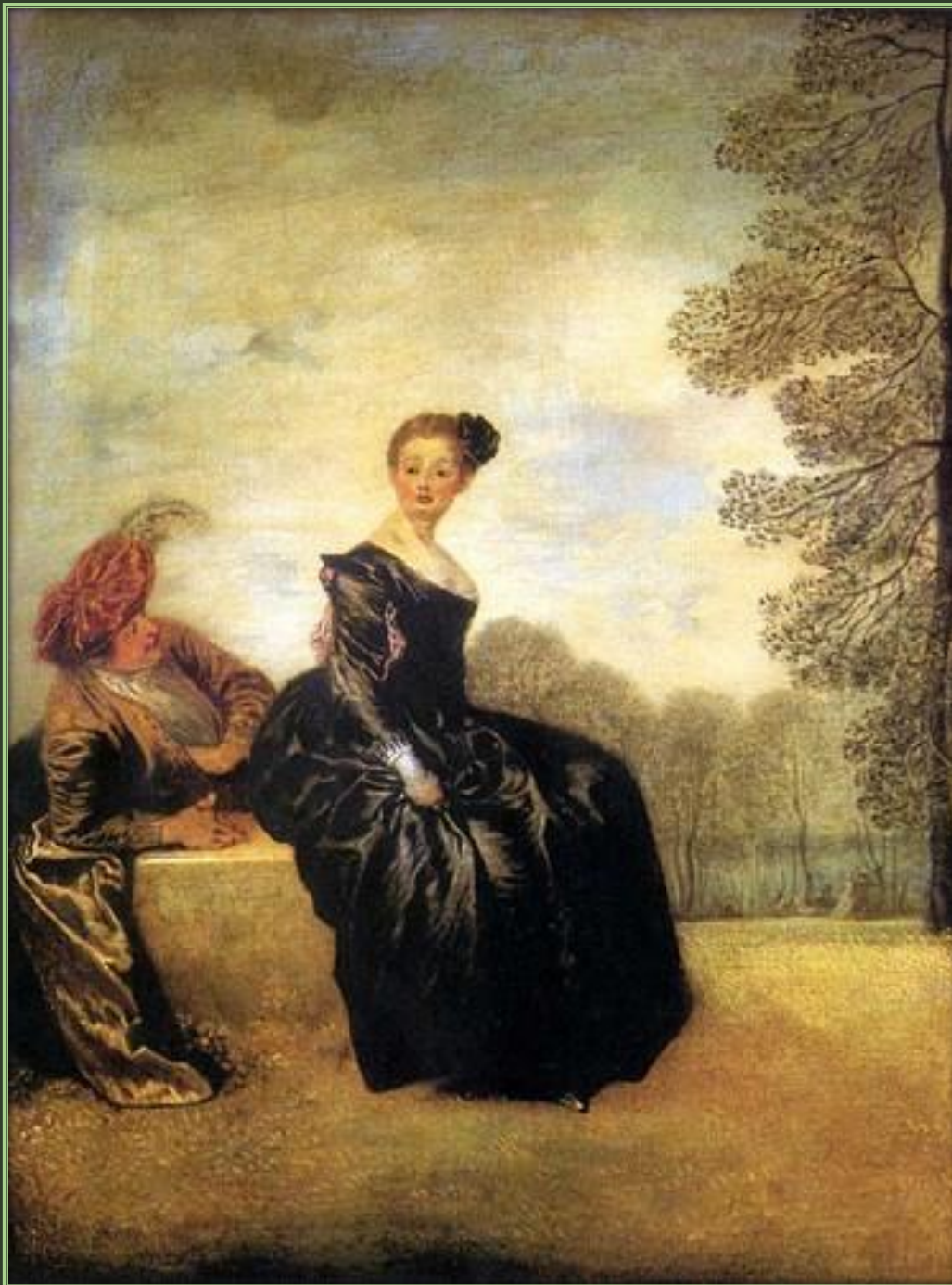
Антуан Ватто. Капризница, 1718 Холст, масло. Государственный Эрмитаж, Санкт-Петербург