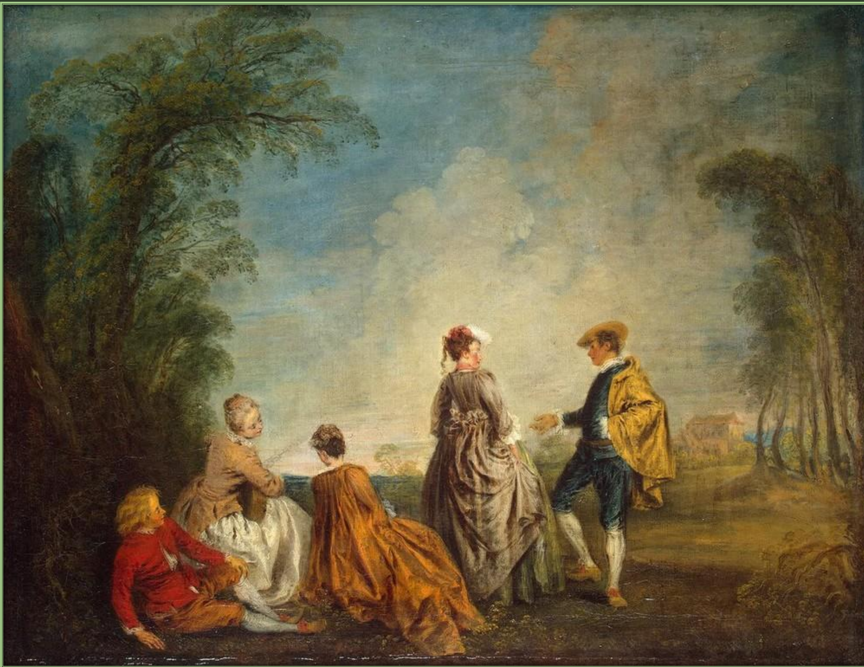
Антуан Ватто. Затруднительное положение, 1715 – 1716. Холст, масло. Государственный Эрмитаж, Санкт-Петербург