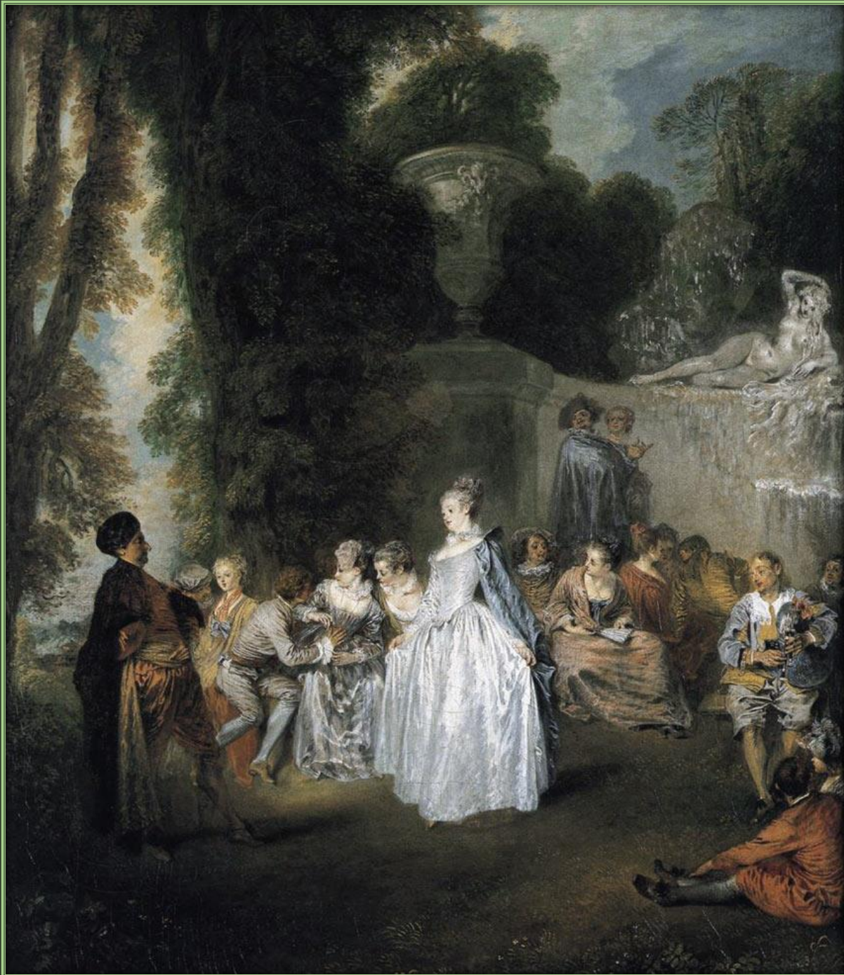
Антуан Ватто. Венецианский праздник, 1718 – 1719 Холст, масло. Национальная Галерея Шотландии, Эдинбург