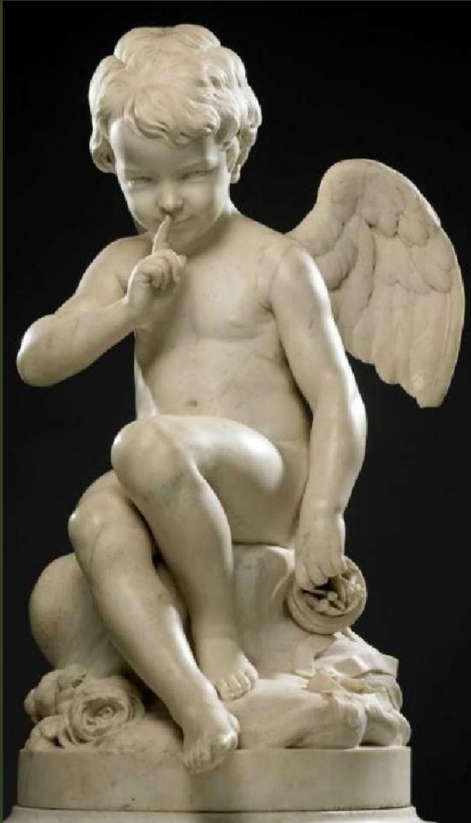
Этьен Морис Фальконе. Грозящий Амур, 1755