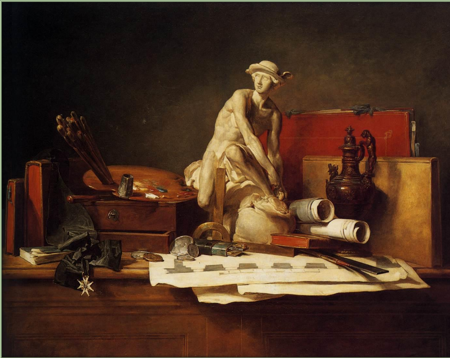
Жан Батист Симеон Шарден. Натюрморт с атрибутами искусства, 1766. Холст, масло. Государственный Эрмитаж, Санкт-Петербург