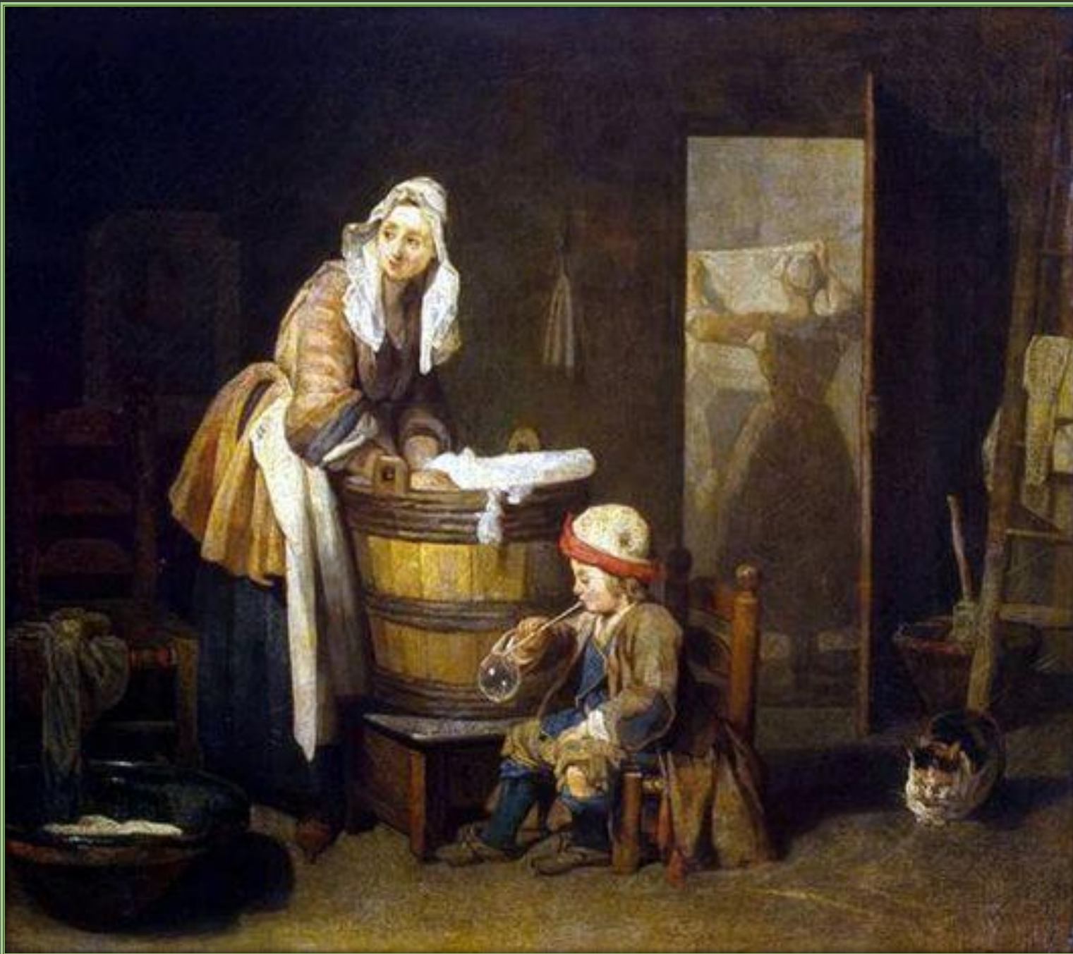
Жан Батист Симеон Шарден. Прачка, 1737. Холст, масло. Государственный Эрмитаж, Санкт-Петербург