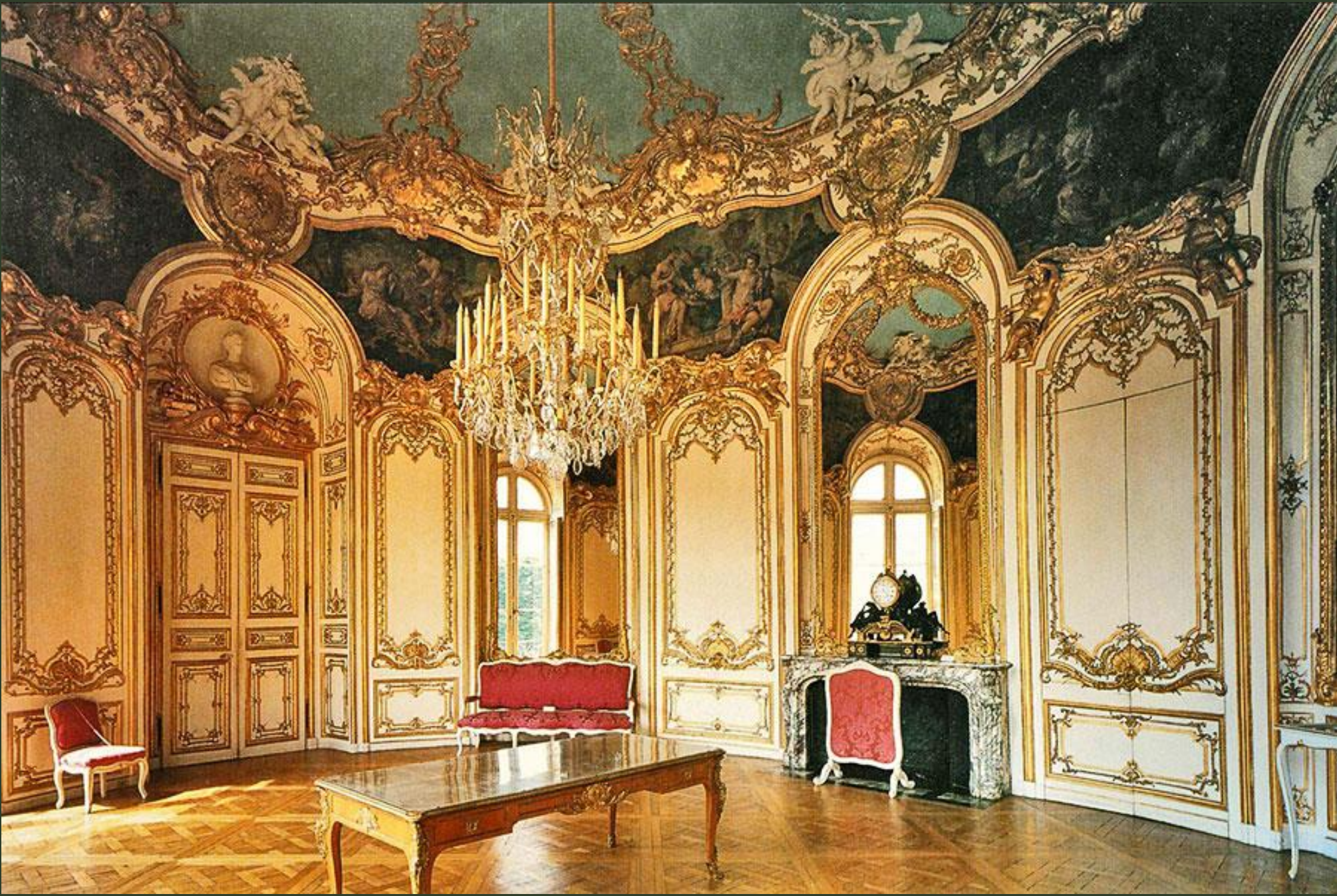
Декоратор Жермен Боффран. «Салон Принцессы» или «Овальный салон» отеля Де Субиз. 1735 – 1738