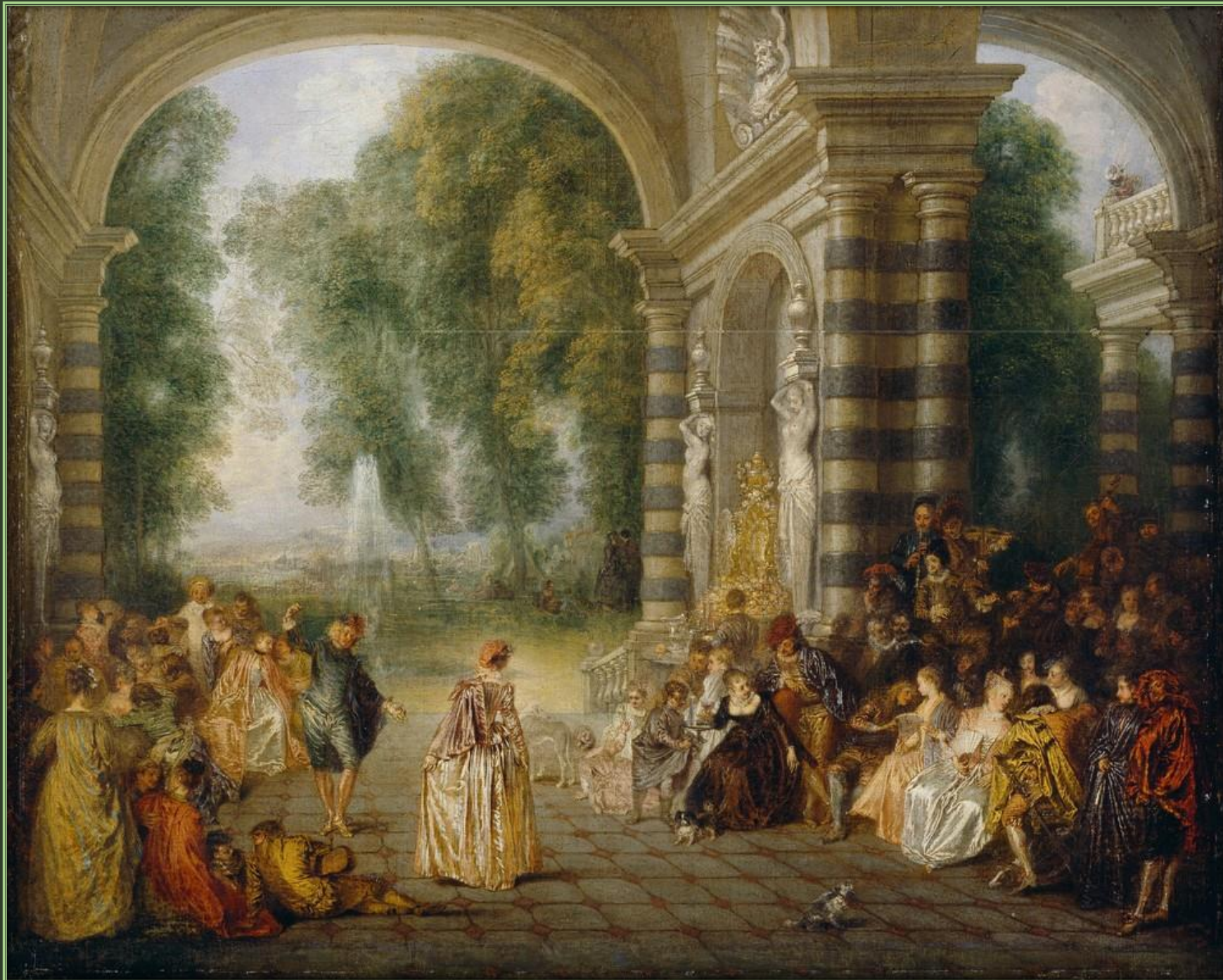
Антуан Ватто. Радости бала, 1717. Холст, масло. Далиджская картинная галерея, Лондон.