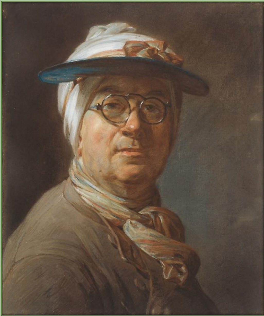
Жан Батист Симеон Шарден. Автопортрет с зеленым козырьком, 1775