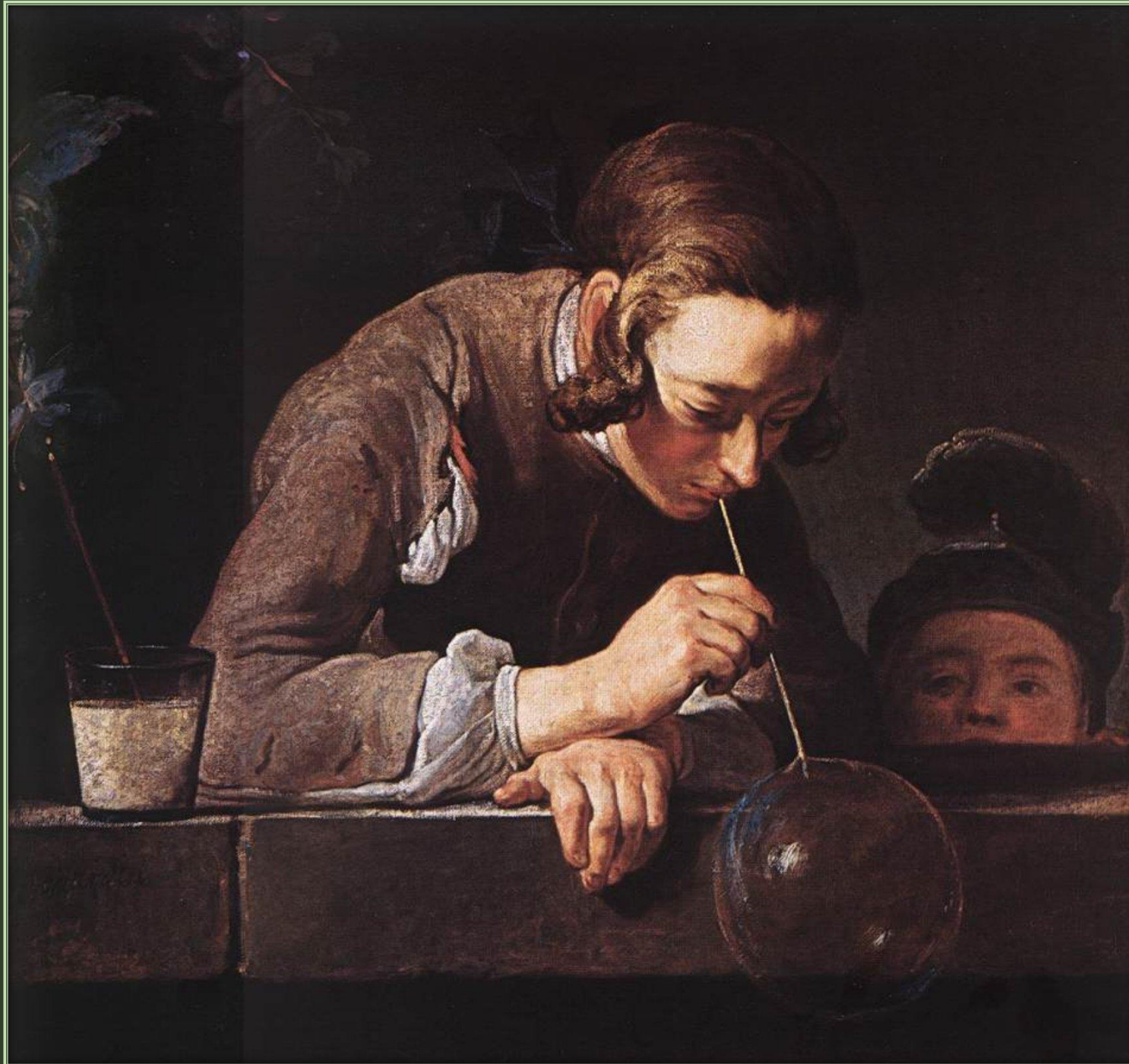
Жан Батист Симеон Шарден. Мыльные пузыри, 1739. Холст, масло. Музей искусств округа Лос-Анджелес