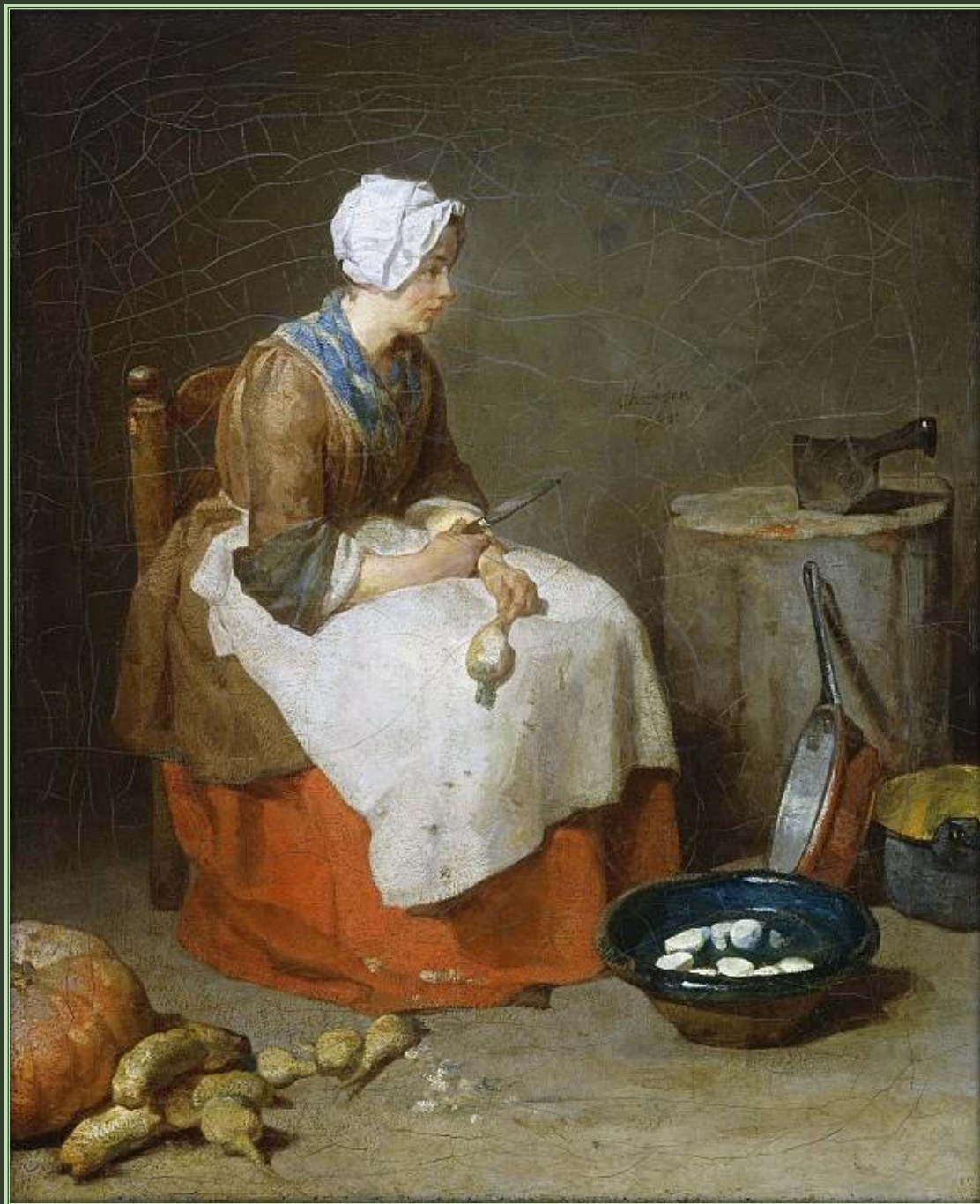
Жан Батист Симеон Шарден. Кухарка, 1738. Холст, масло. Национальная галерея искусств, Вашингтон