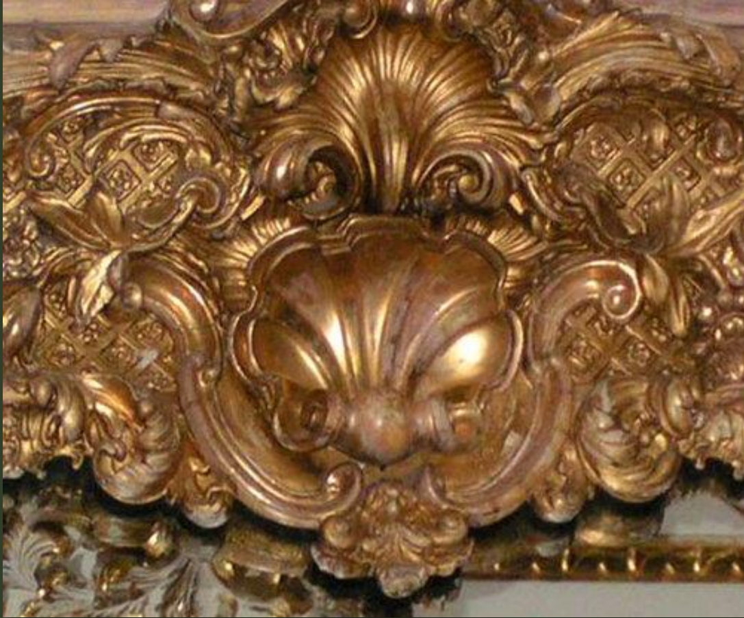
Орнаментальный элемент на мотив створки раковины