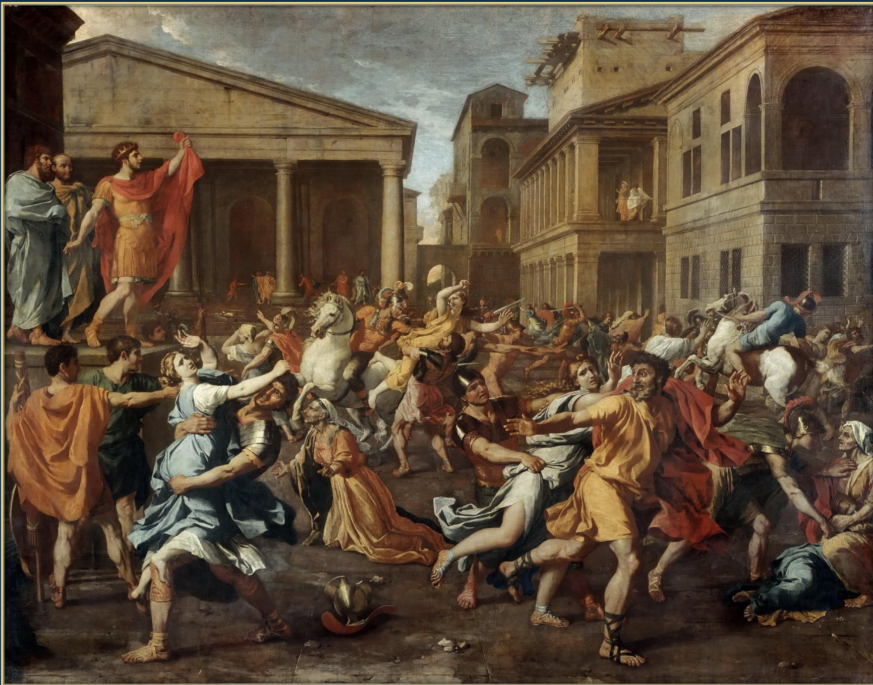
Никола Пуссен. Похищение сабинянок, 1638. Холст, масло. Лувр, Париж