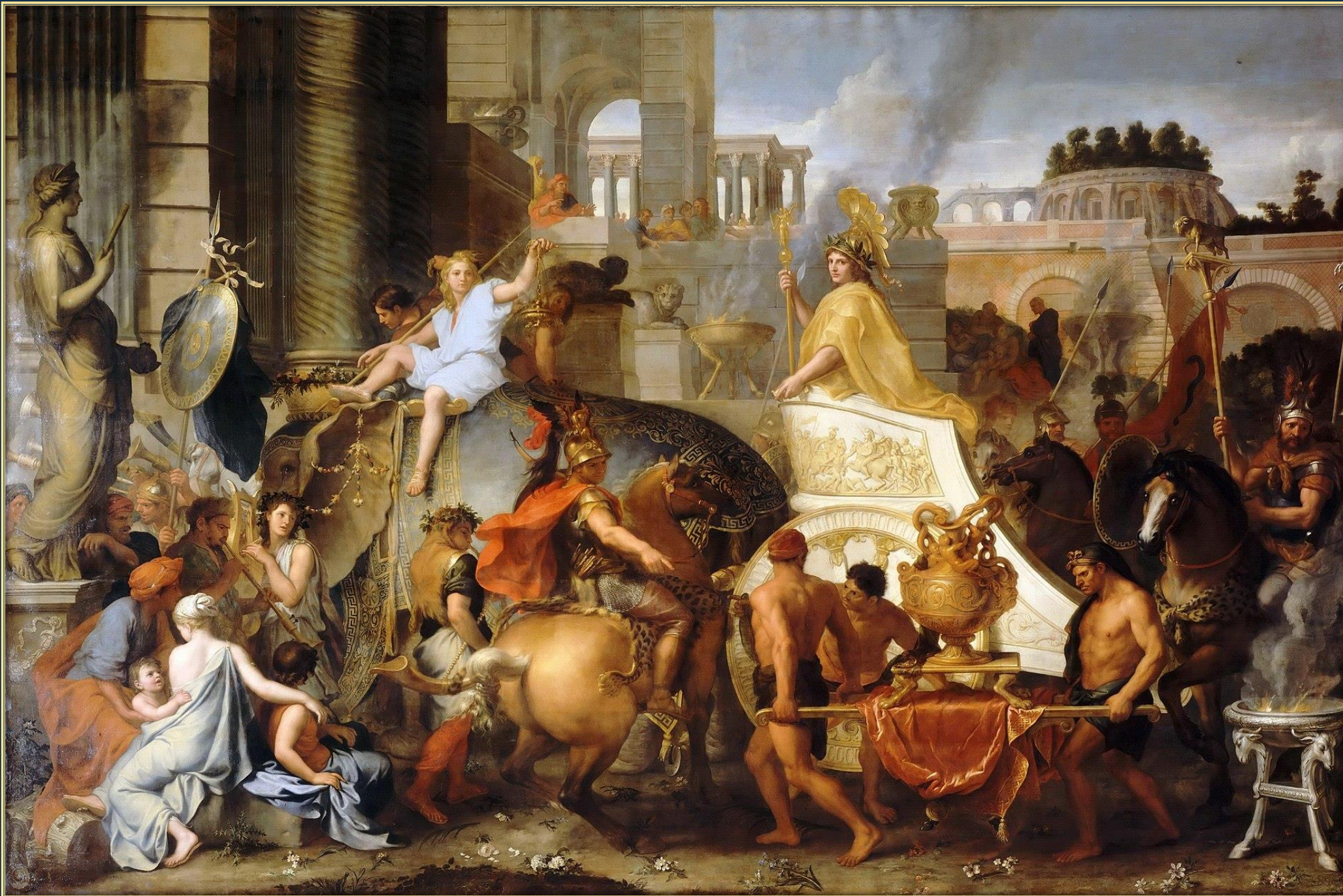
Шарль Лебрен. Вступление Александра в Вавилон, 1664. Холст, масло. Лувр, Париж