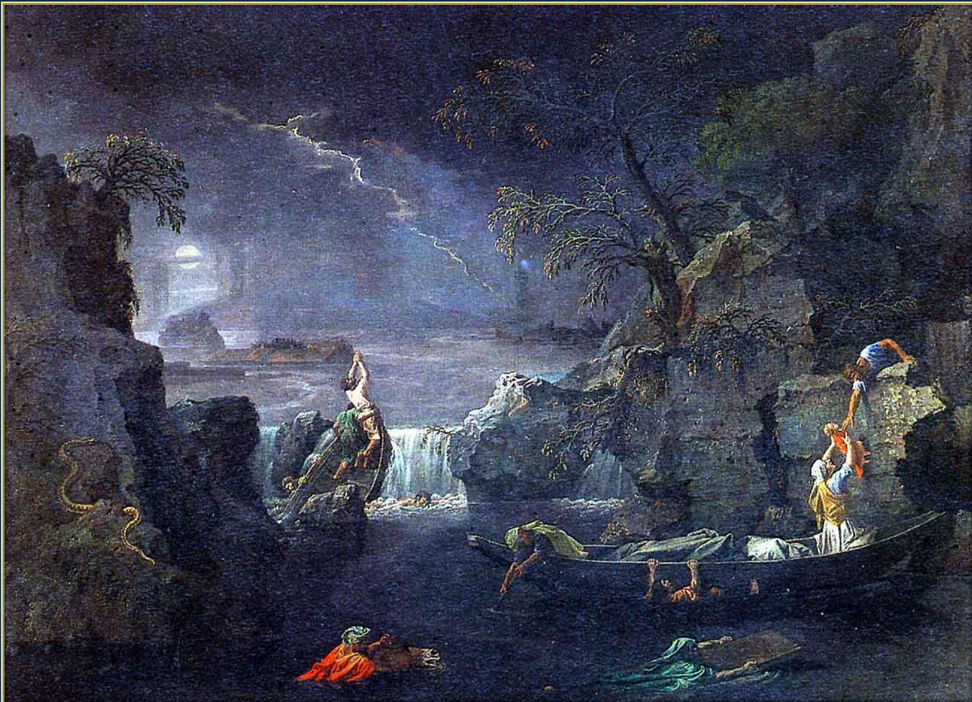
Никола Пуссен. Зима или Потоп (из серии «Четыре времени года») ок. 1660 – 1664. Холст, масло. Лувр, Париж