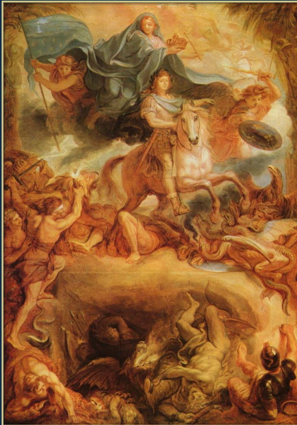
Шарль Лебрен. Апофеоз Людовика XIV, 1677. Холст, масло. Венгерский музей изобразительных искусств (Будапешт)