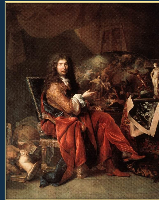
Шарль Лебрен (Франция) 1619 – 1690