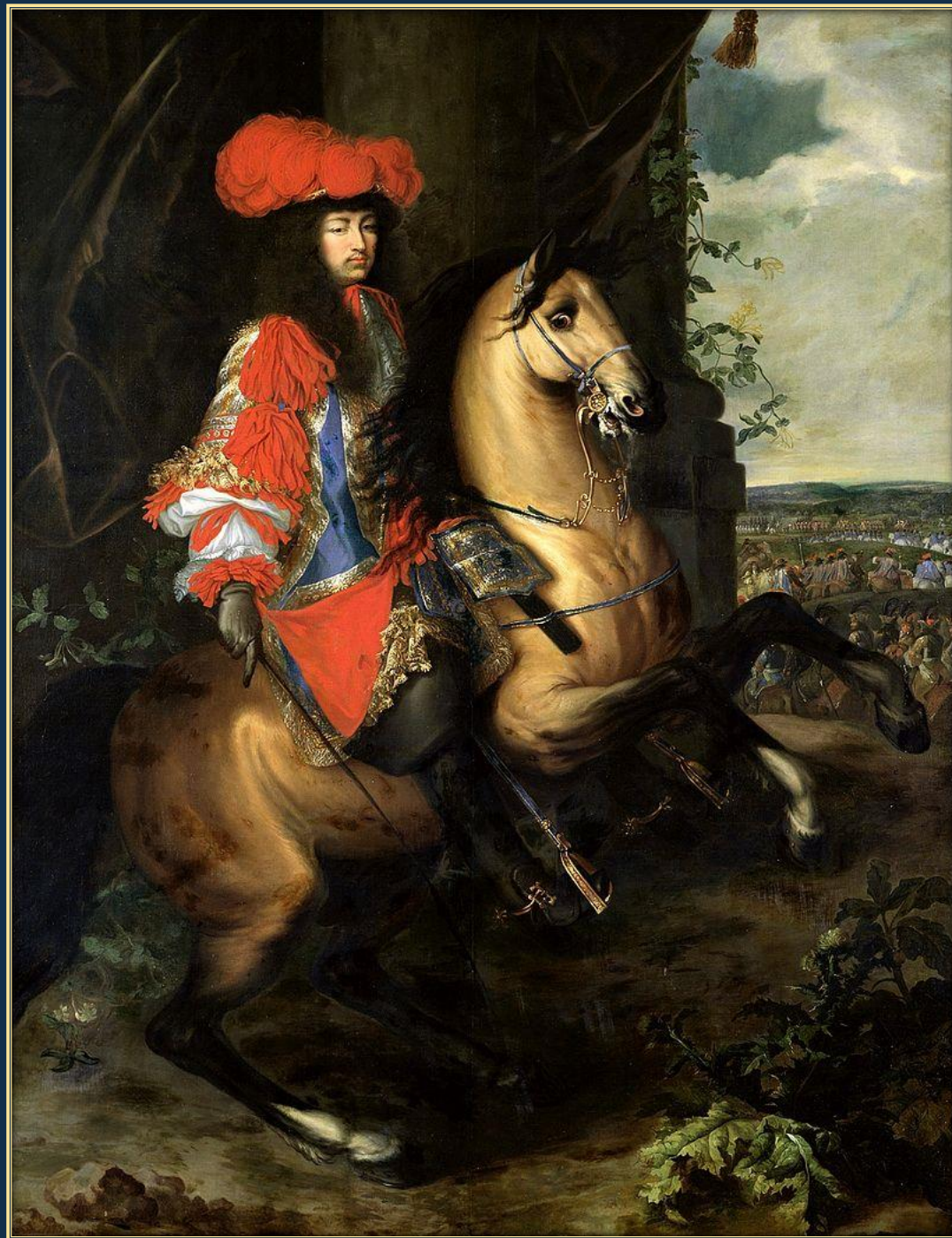
Шарль Лебрен. Конный портрет Людовика XIV, ок. 1668. Холст, масло. Музей Турне (Бельгия)