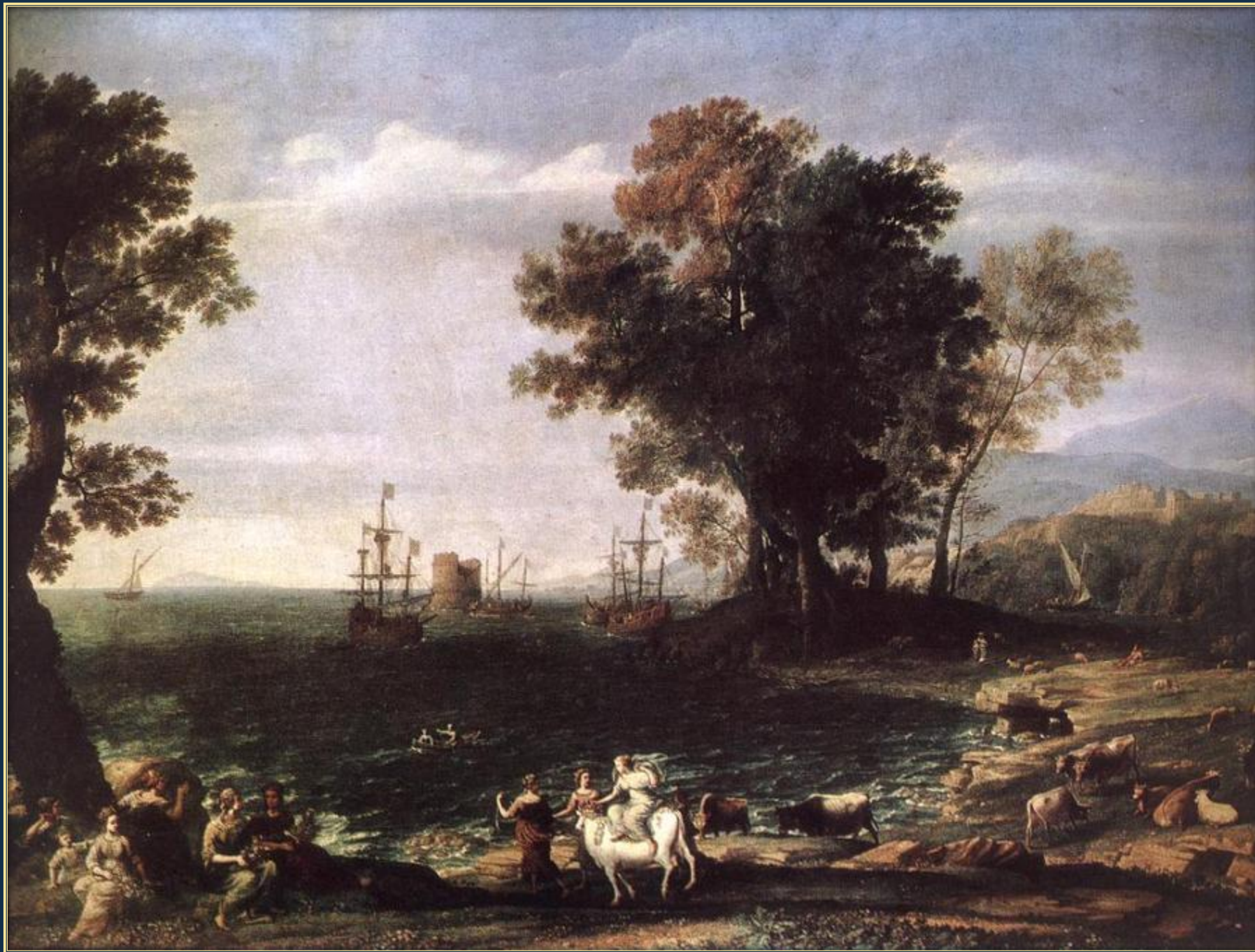
Клод Лоррен. Похищение Европы, 1655. Холст, масло. Государственный музей изобразительных искусств им. А. С. Пушкина, Москва