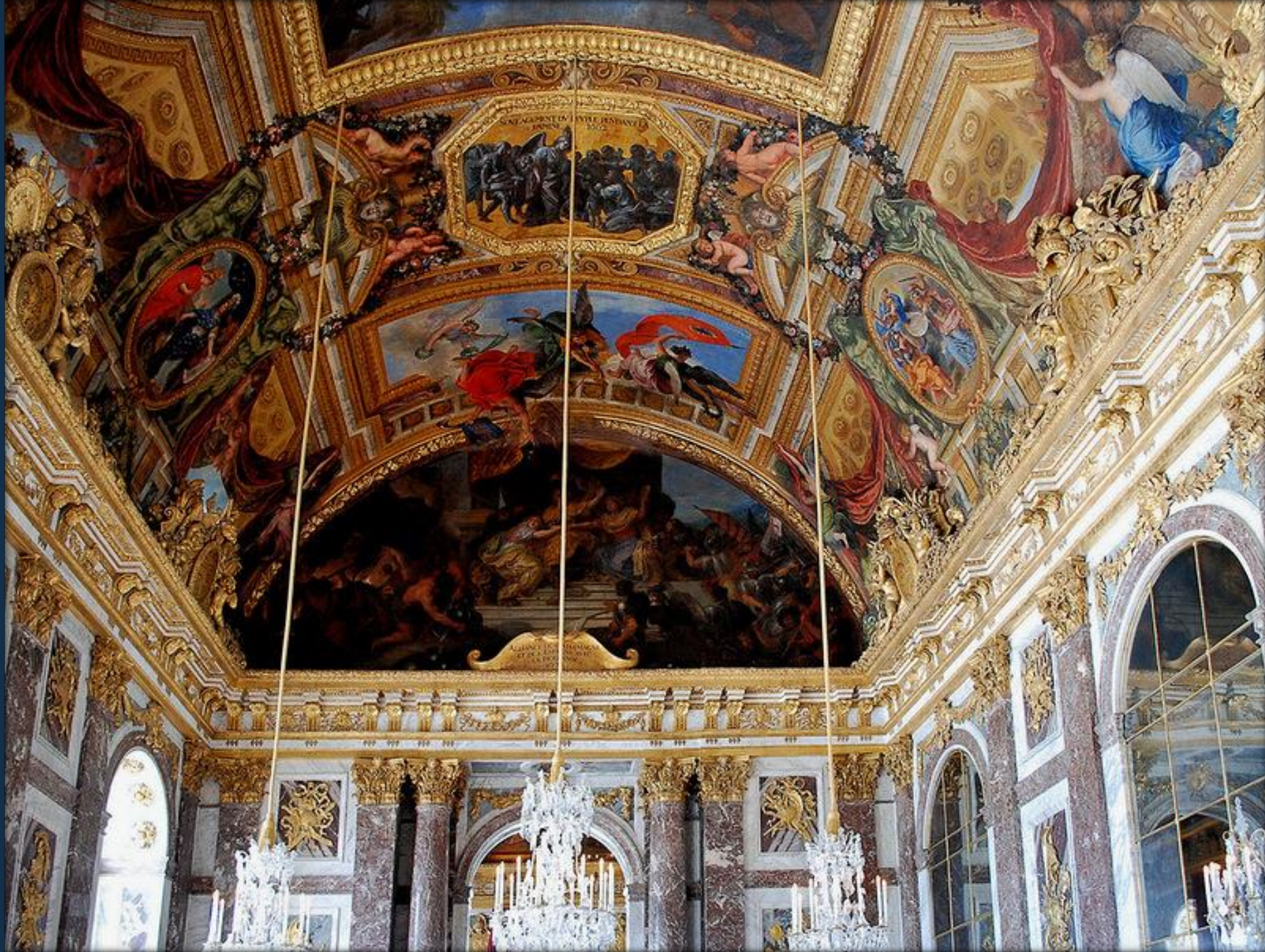
Шарль Лебрен. Роспись плафона Зеркальной галереи Большого дворца в Версале, 1678.