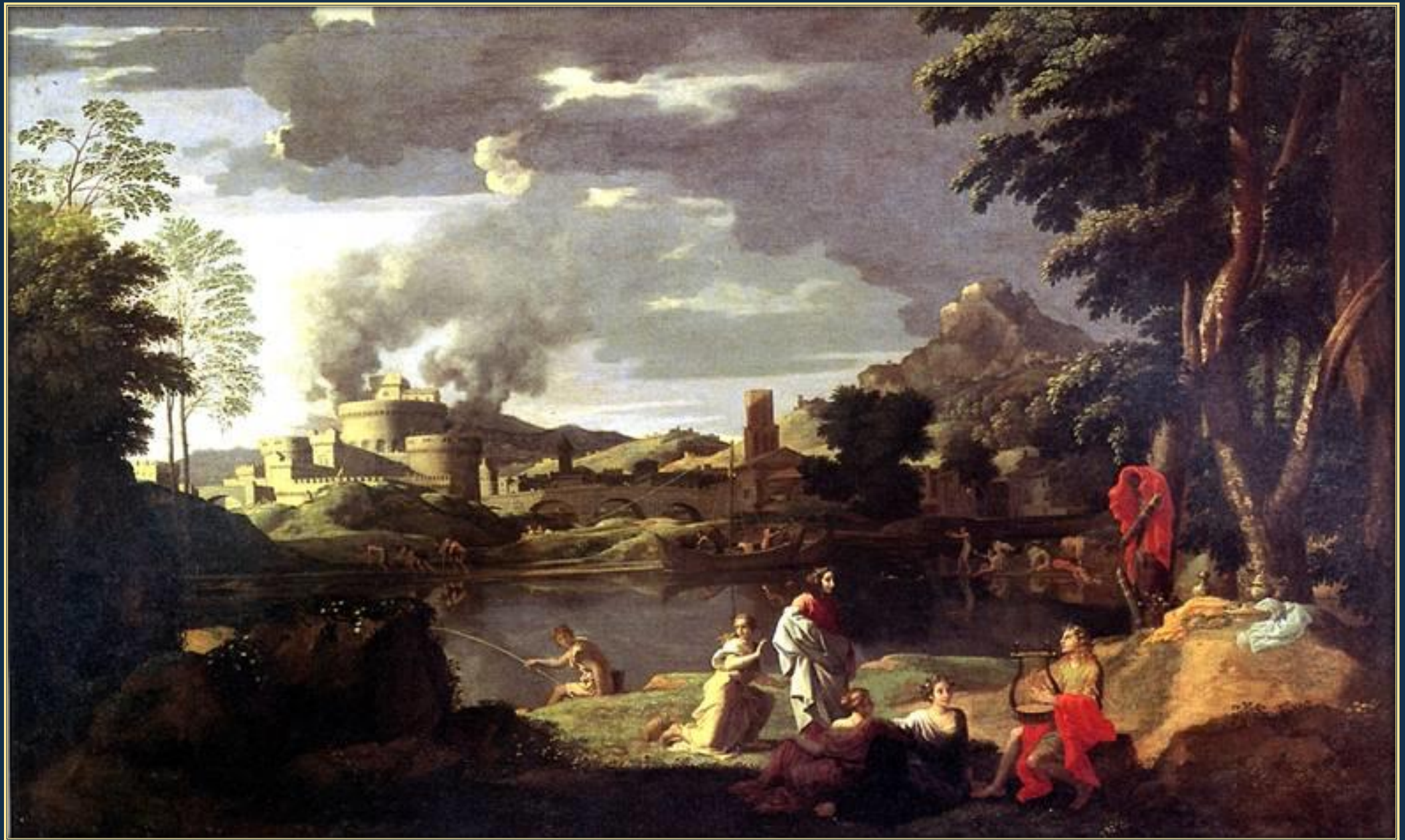
Никола Пуссен. Орфей и Эвридика, 1648. Холст, масло. Лувр, Париж