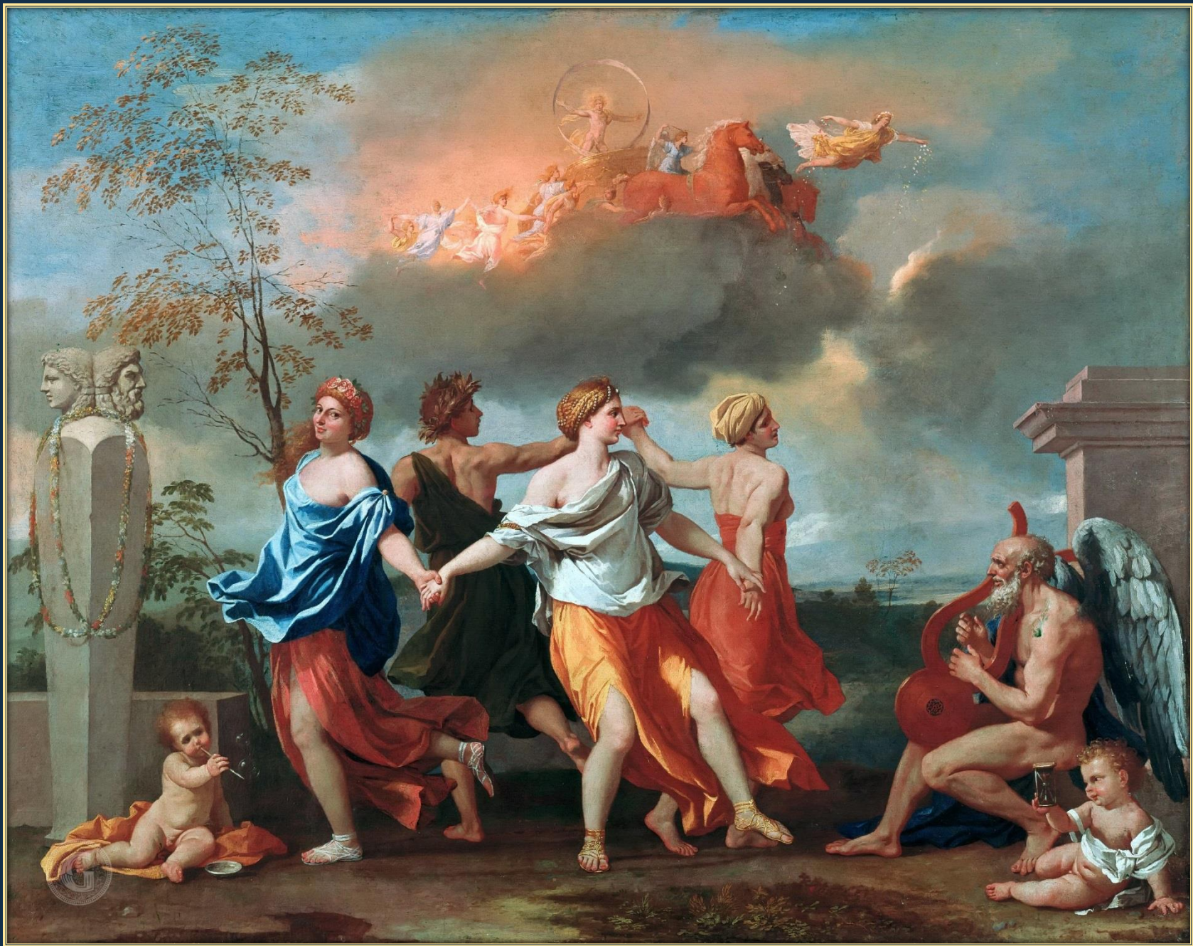
Никола Пуссен. Танец под музыку времени, 1634 – 1636. Холст, масло. Собрание Уоллес, Лондон