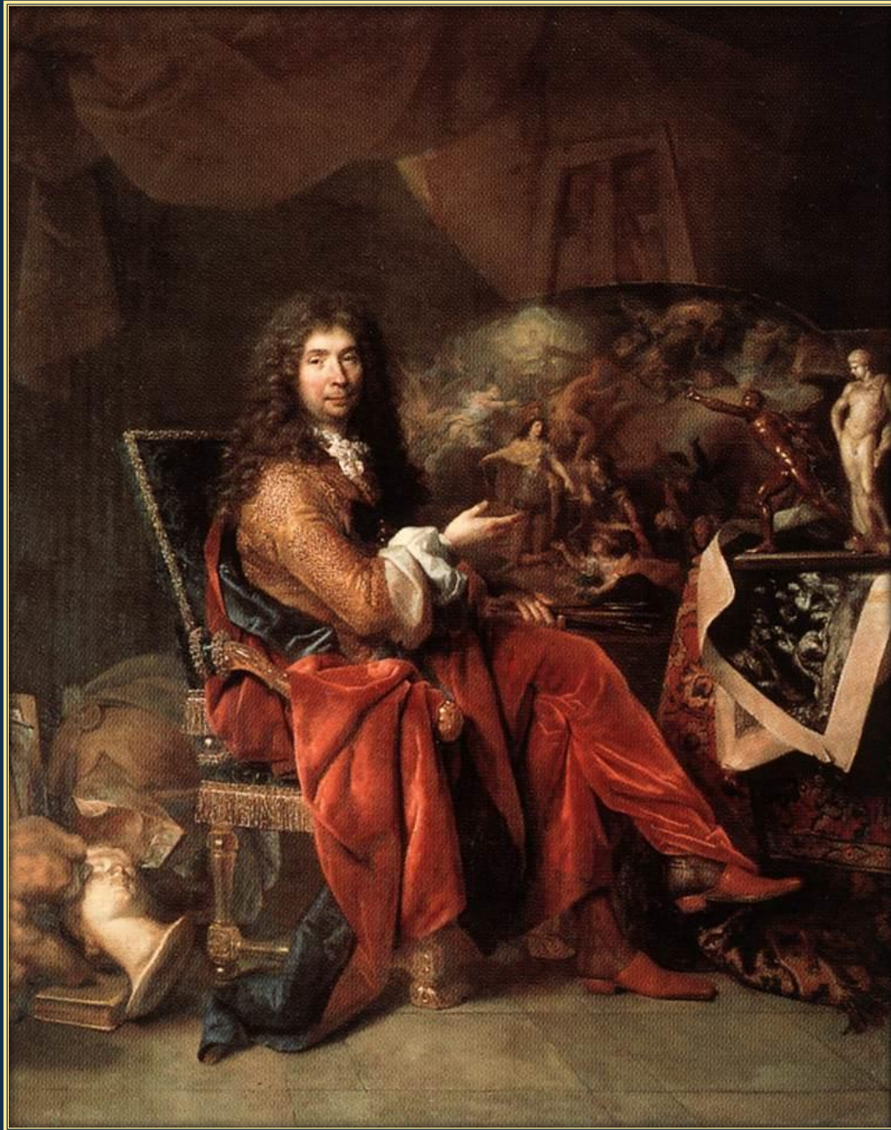
Никола де Ларжильер. Портрет Шарля Лебрэна, 1686