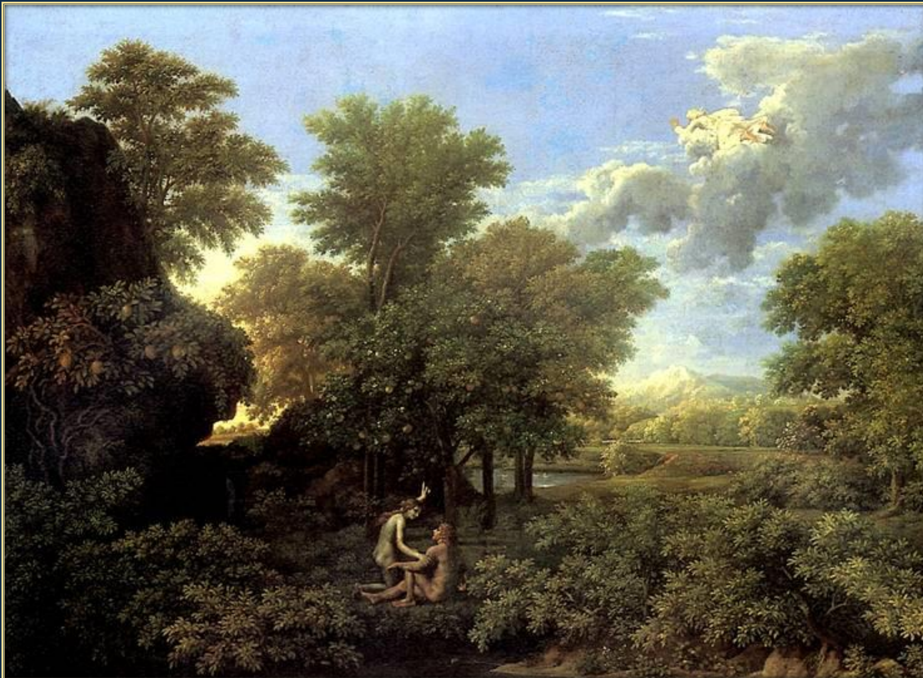
Никола Пуссен. Весна или Земной рай (из серии «Четыре времени года»). ок. 1660 – 1664. Холст, масло. Лувр, Париж