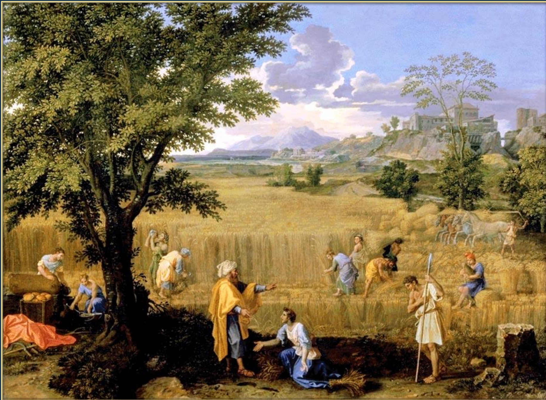
Никола Пуссен. Лето или Руфь и Вооз (из серии «Четыре времени года»). ок. 1660 – 1664. Холст, масло. Лувр, Париж