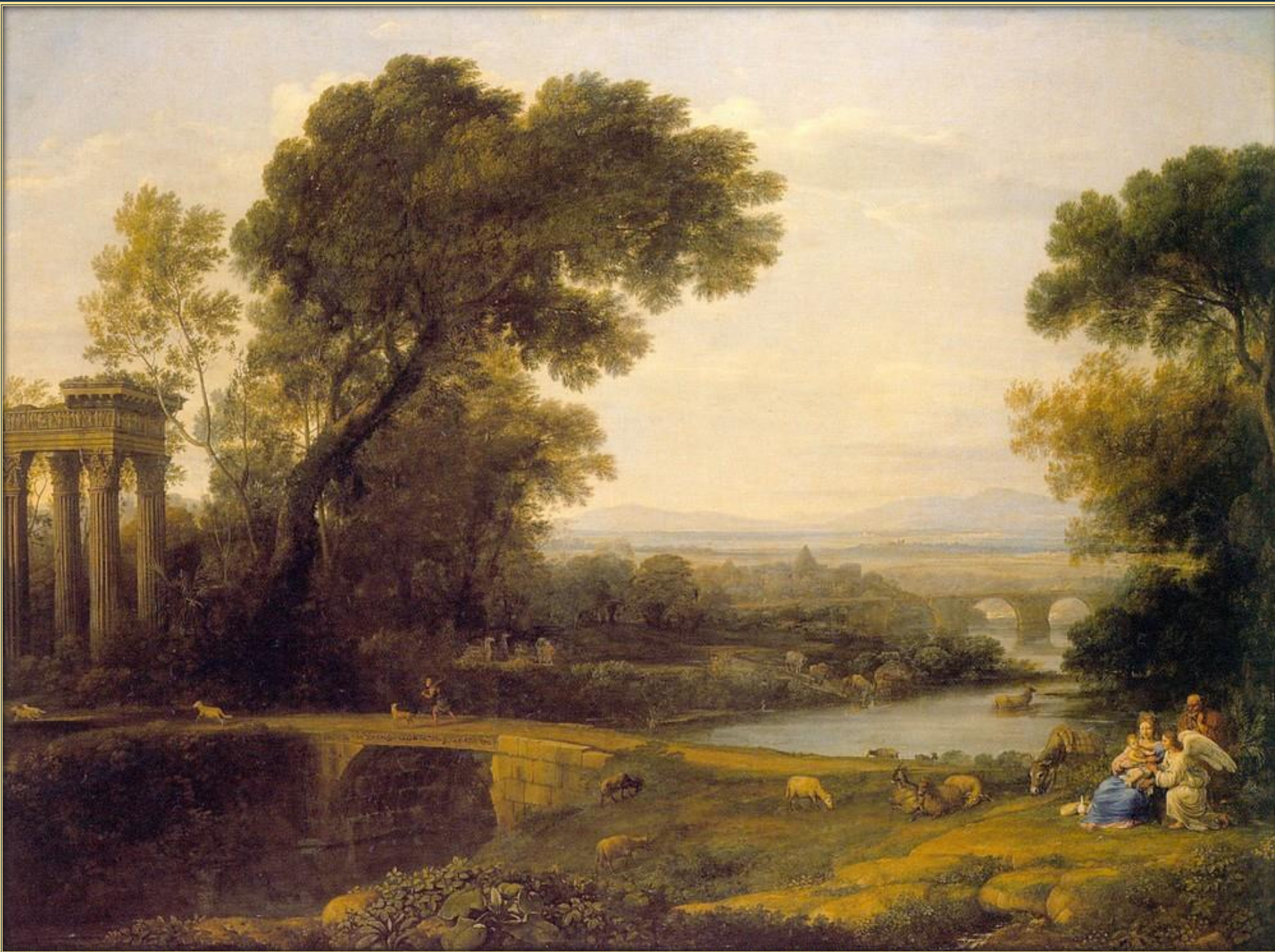
Клод Лоррен. Полдень, 1651 – 1661. Холст, масло. Государственный Эрмитаж, Санкт-Петербург