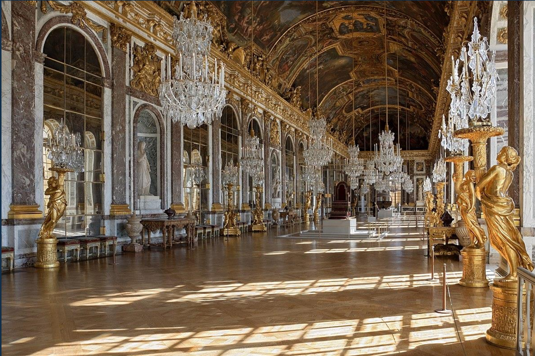
Зеркальная галерея Версаля

К числу наиболее крупных монументально-декоративных работ Лебрена принадлежит плафон Зеркальной галереи Большого дворца в Версале (1678 – 1684), где художник объединил живопись и богатую лепную орнаментику.