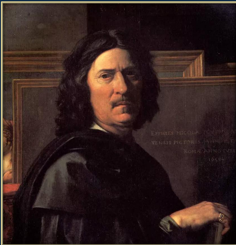
Никола Пуссен (Франция) 1594 – 1665