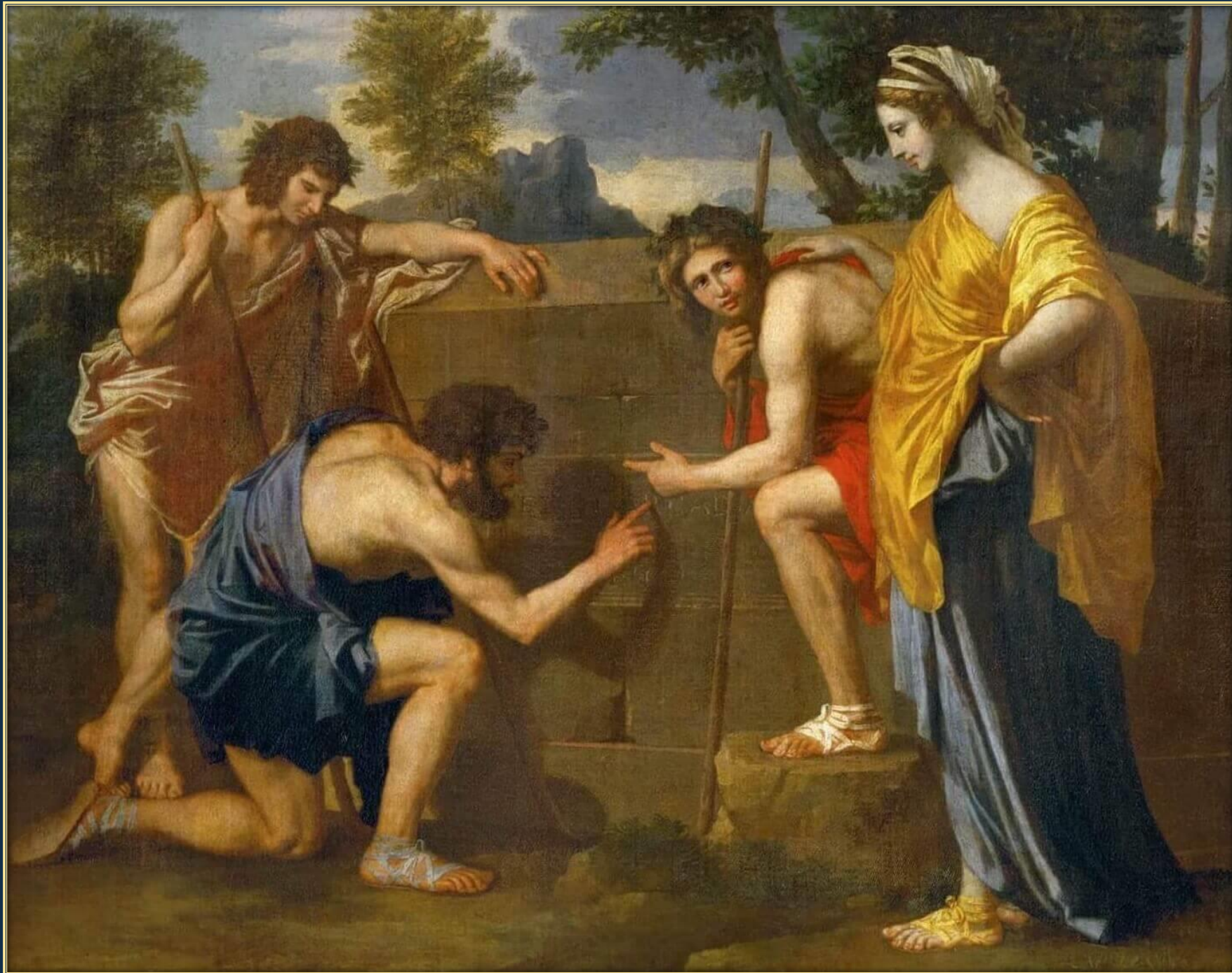
Никола Пуссен. Аркадские пастухи (второй вариант), 1650 – 1655. Холст, масло. Лувр, Париж