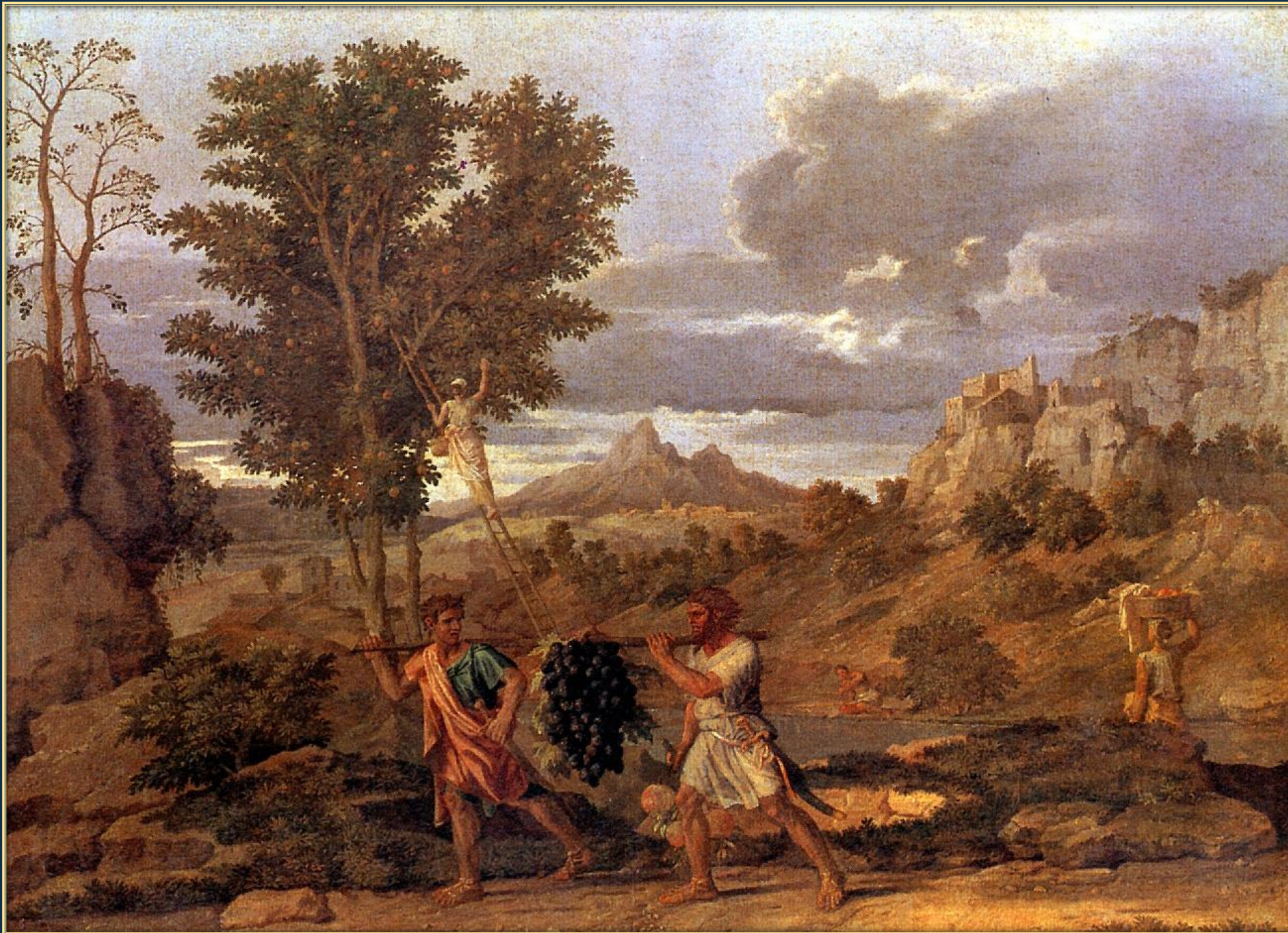
Никола Пуссен. Осень или Дары земли обетованной (из серии «Четыре времени года») ок. 1660 – 1664. Холст, масло. Лувр, Париж