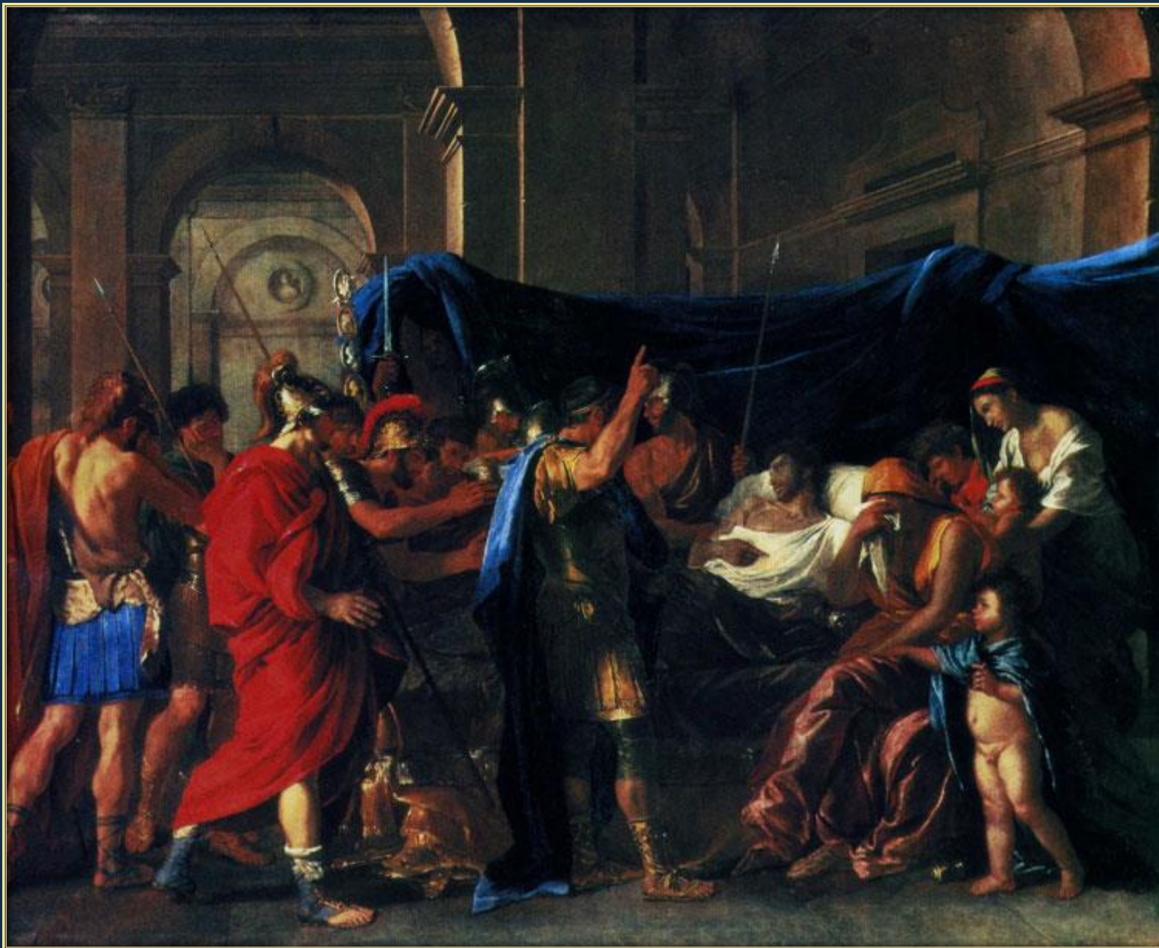
Никола Пуссен. Смерть Германика, 1627. Холст, масло. Институт искусств, Миннеаполис (США)