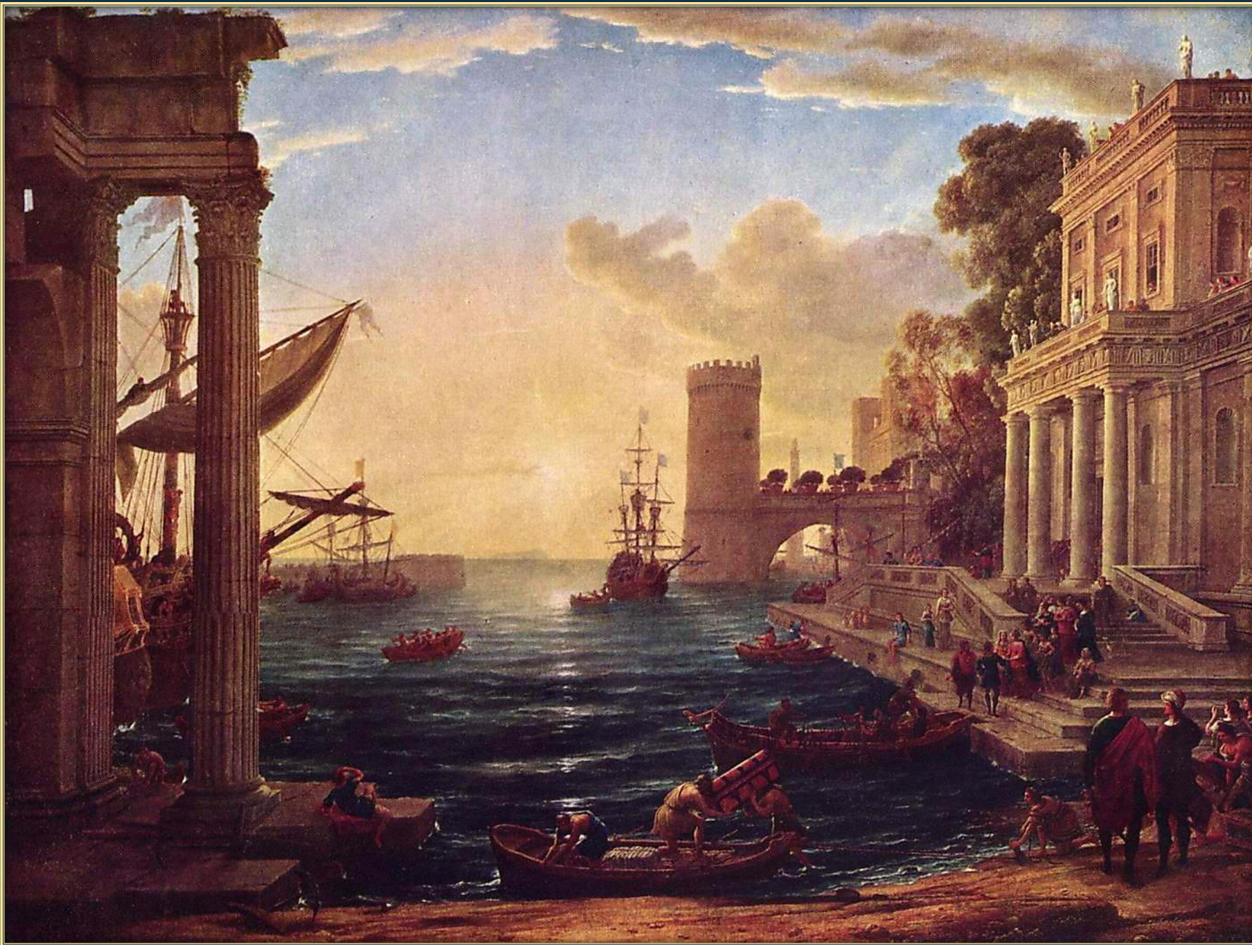
Клод Лоррен. Отплытие царицы Савской, 1648. Холст, масло. Лондонская национальная галерея