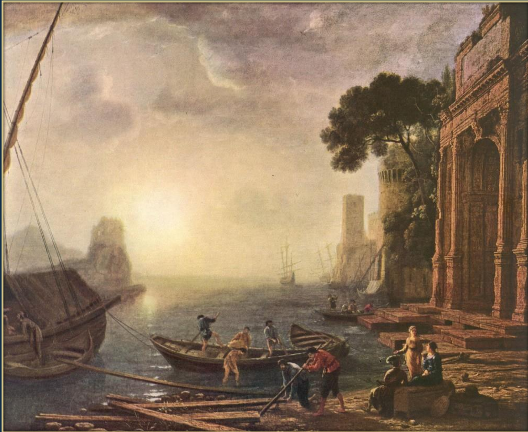
Клод Лоррен. Утро в гавани, ок.1640. Холст, масло. Государственный Эрмитаж, Санкт-Петербург