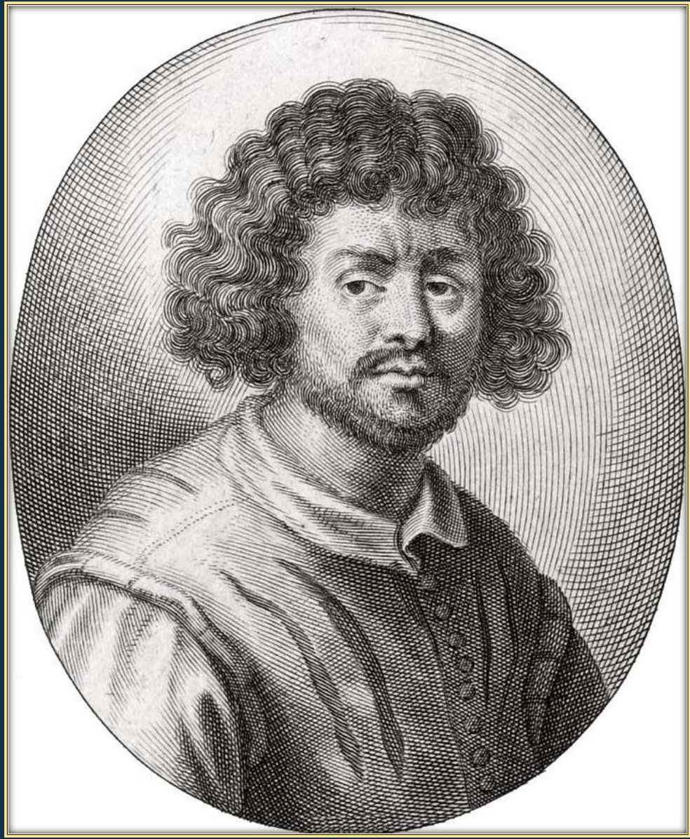
Иоахим фон Зандрарт. Клод Лоррен, гравюра